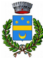
Comune di Licciana Nardi (MS)