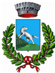
Comune di Fosdinovo (MS)